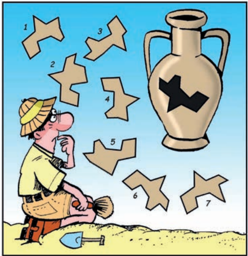
rys. K. Zalepa